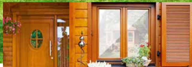
Fassaden, Türen & Fenster (einschl. Innenseiten)

Ideal für alle neuen und alten Hölzer im Außenbereich und insbesondere für hochwertige Holzbauteile, die einen langjährigen, umfassenden Schutz vor Witterung benötigen: